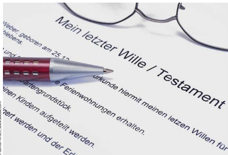
Testament: Handschriftlich oder beim Notar.

Auch ein auf einem Notizzettel (Format 10 x 7 cm) errichtetes Testament kann wirksam sein und zwar auch dann, wenn das Papier teilweise eingerissen ist. Im Zweifel ist der Testierwille des Erblassers durch weitere, außerhalb der letztwilligen Verfügung liegende Umstände zu ermitteln (OLG München, Beschl. v. 28.01.2020, 31 Wx 229/19, 31 Wx 230/19, 31 Wx 231/19). Steuerbegünstigte Orga-